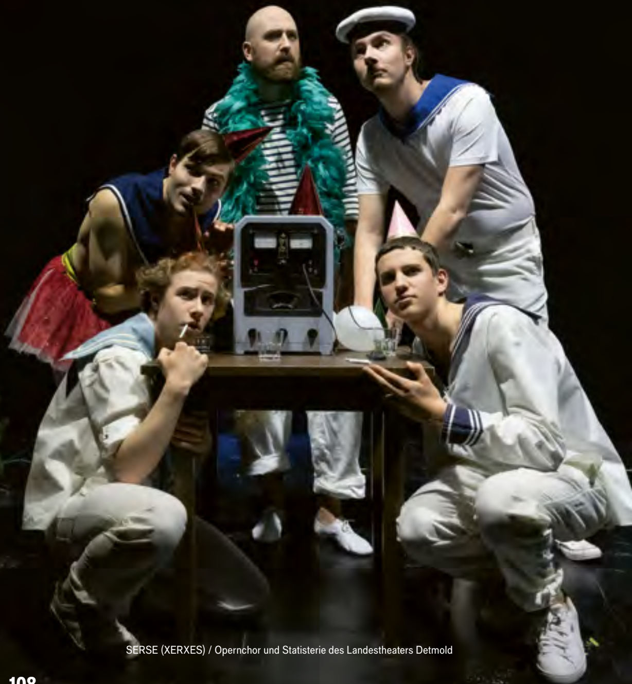
SERSE (XERXES) / Opernchor und Statisterie des Landestheaters Detmold